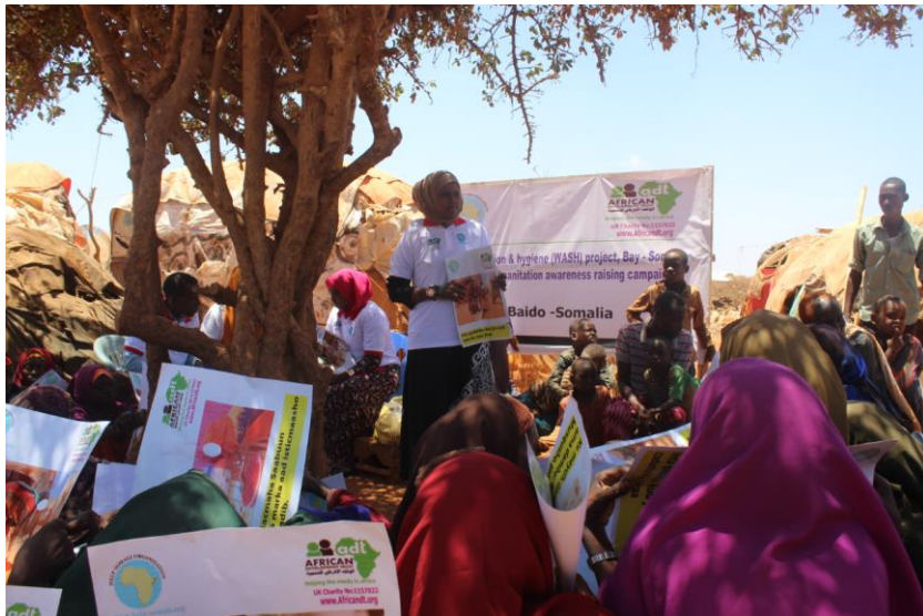
WASH Bay Südsomalia 2019; Hygieneschulung

first-hand, dedicated, interconnected Help-Somali.org