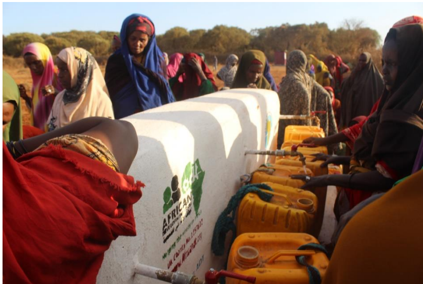
WASH Bay Süsomalia 2019

Bedauerlicherweise ferner nicht umgesetzt werden konnte der Projektortbesuch in Somalia, ein weiteres Jahresziel. Die für den Herbst geplante Reise zum bestehenden WASH-Projekt in Waaberi Baidoa durch das Präsidium und ein Vereinsmitglied musste wegen der allgemeinen politischen Lage, insbesondere der Präsenz der al Shabbab und der geplanten Präsidentschaftswahlen, sowie wegen den nicht absehbaren Auswirkungen der Corona-Pandemie abgesagt werden.