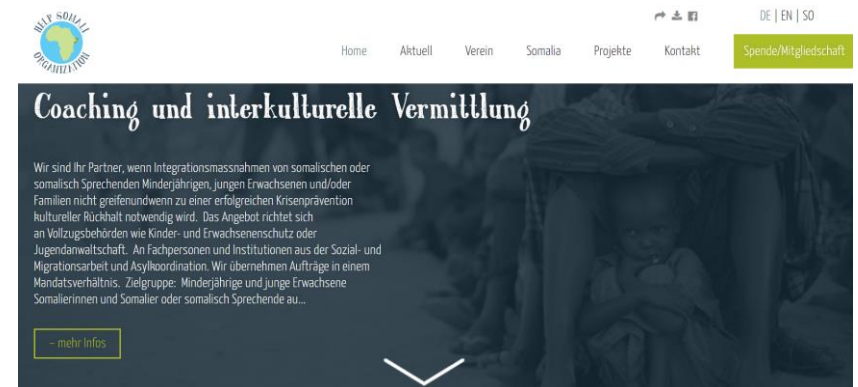
Ausschnitt Website Help Somali Organization

Das neue Angebot entspricht einem aktuellen Bedarf und ist gut angelaufen. Es wurde vier Mandate seit Juni eröffnet.